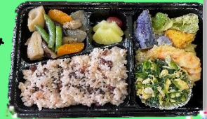
敬老の日のお弁当

私たちはゆうあいセンターのすばるの施設で毎週水曜日にふれあい弁当を作っている調理ボランティア「えぷろん」です。ふれあい弁当は調理困難な高齢者・障がい者を対象に安否確認を目的とした配食サービスです。毎週水曜日に活動しています。朝9時~11時までに40食のお弁当を作り上げます。みんなお料理大好きで楽しみながら調理しています。興味のある方!!ぜひお問合せください!