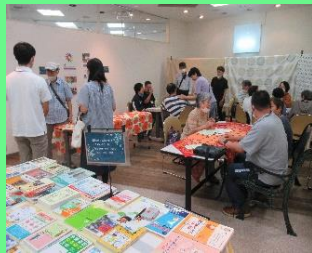
手話カフェの様子

活動場所: 日生住民サービス 活動時間: 毎週水曜日 19時15分~20時45分