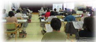
4年前の講座の様子