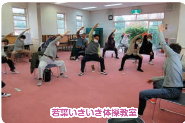
若葉いきいき体操教室