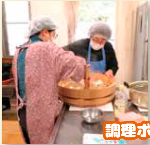
調理ボランティア「えぶろん」の皆さん