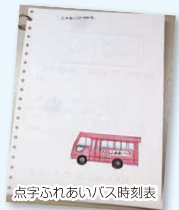
点字ふれあいバス時刻表