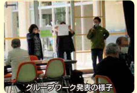
グループワーク発表の様子