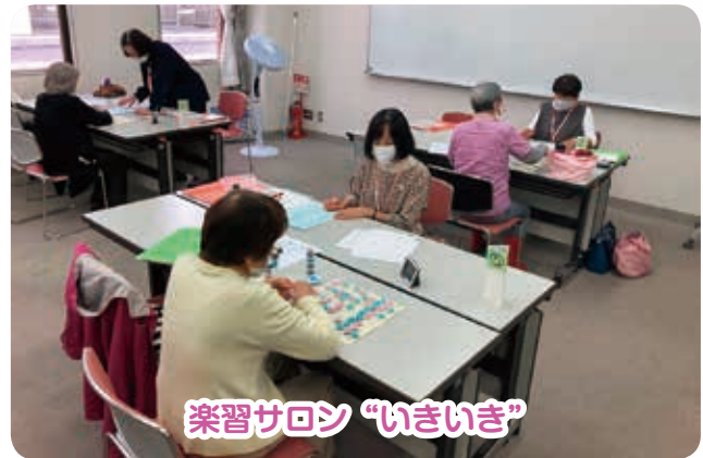
楽習サロン “いきいき”