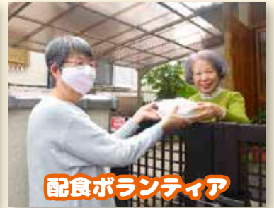
配食ボランティア